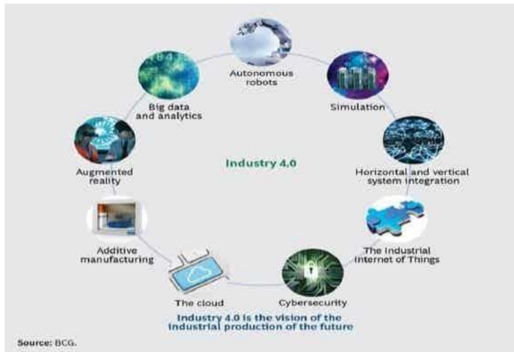
Gambar 2.1 Teknologi Produksi Bertransformasi dalam Industri 4.0

Pada revolusi industri 4.0, teknologi informasi dan komunikasi dimanfaatkan sepenuhnya. Tidak hanya dalam proses produksi, melainkan juga di seluruh rantai nilai kegiatan sehingga melahirkan model bisnis yang baru dengan basis digital guna mencapai efisiensi yang tinggi dan kualitas produk yang lebih baik. Revolusi Industri merupakan titik balik dalam sejarah yang ditandai dengan perubahan secara besar-besaran di berbagai bidang.